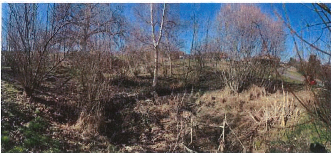
Figure 4. Végétation du grand bassin – février 2024

La végétation ligneuse est caractérisée par quelques bouleaux, une vingtaine de saules têtards, quelques arbustes et un taillis au centre du grand bassin. Elle n'a pas été entretenue depuis plusieurs années. Le feuillage issu de cette strate est source d'accumulation de matière végétale dans les plans d'eau et limite l'ensoleillement du biotope.