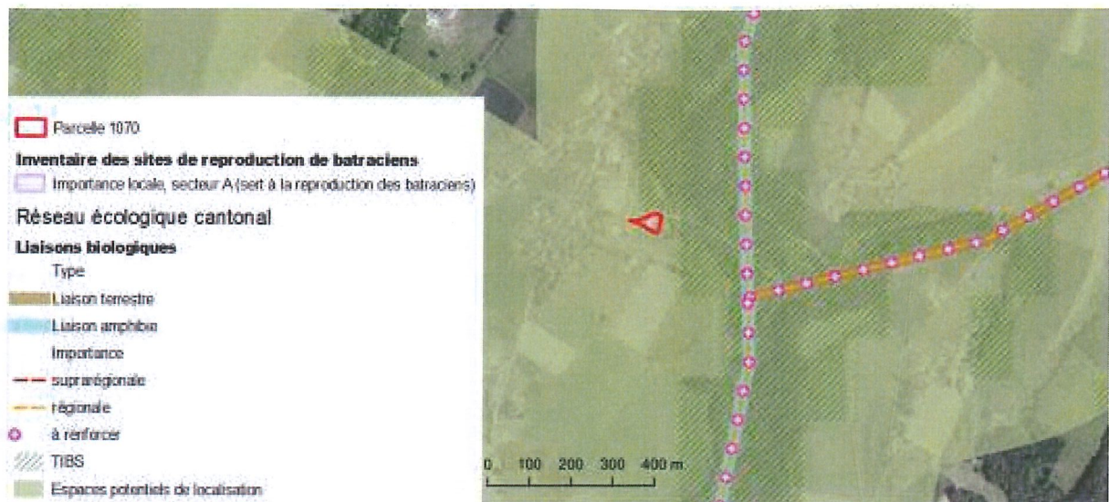
Figure 2. Localisation de la parcelle dans le réseau écologique cantonal (1/10'000)