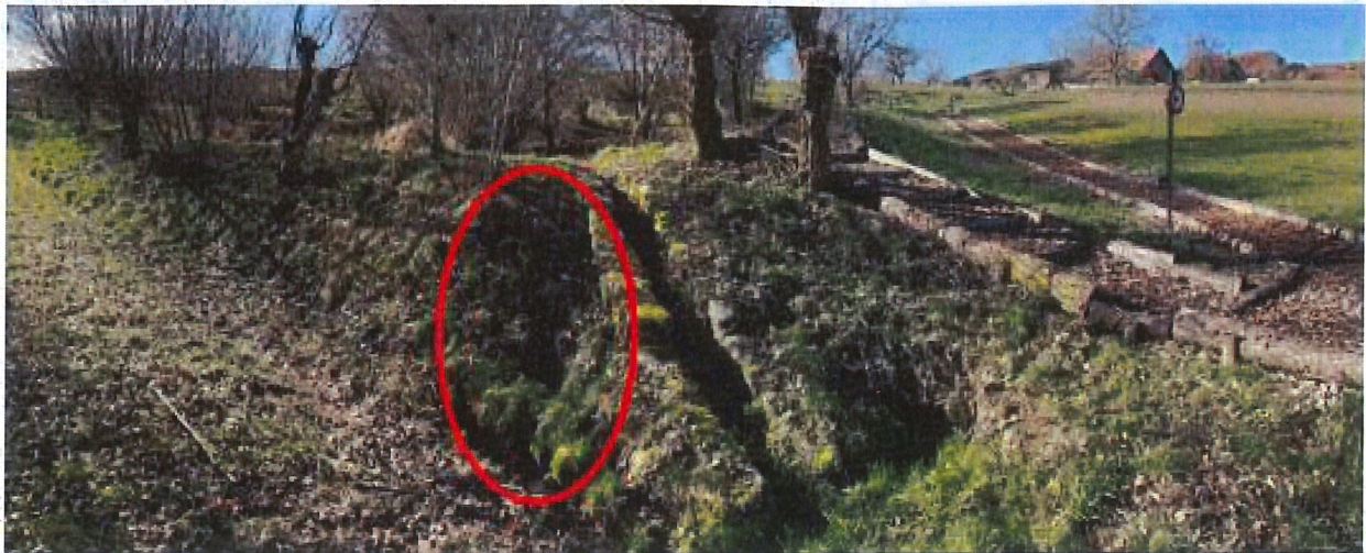
Figure 3. Renard hydraulique sous la digue au niveau de l'exutoire du grand bassin

La végétation des plans d'eau est dominée par les massettes ( Typha latifolia , Figure 4). Les milieux aquatiques s'étant altérés par dépôt de matière organique (terre, végétaux), la flore aquatique n'est plus visible dans les bassins.